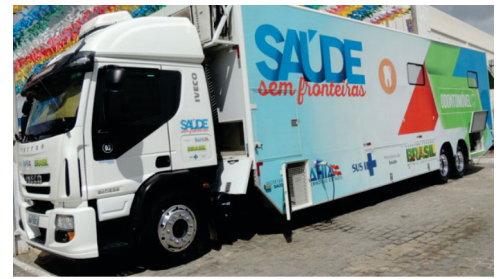
Mais de 600 pessoas atendidas no ônibus odotomóvel do Governo.