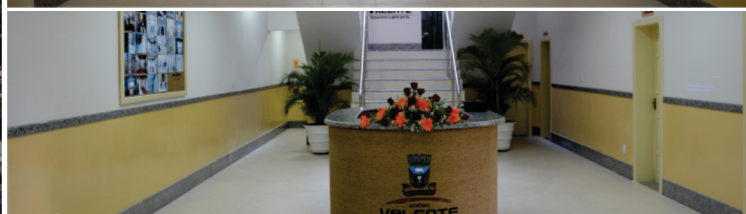
Reforma e ampliação do prédio da Prefeitura Municipal com recursos próprios