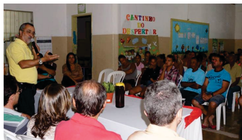
60 títulos entregues aos proprietários das casas populares em Valilândia.