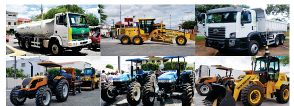
Renovação da frota do município com aquisição de 07 máquinas: 01 caçamba, 01 patrol, 01 caminhão pipa, 01 pá carregadeira, 01 retro escavadeira e 02 patrulhas mecanizadas.