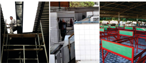
Melhorias no centro de abastecimento: recuperação de barracas, instalação elétrica do mercado de carnes, criação de espaço para venda de peixes e miúdos.