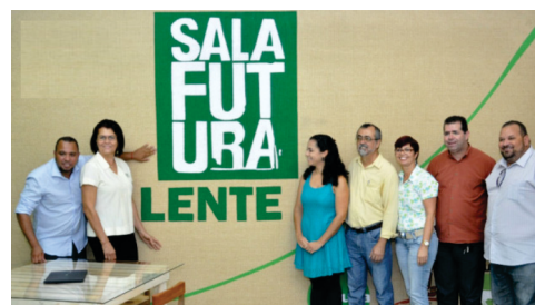
Implantação da Sala Futura no Centro Cultural.