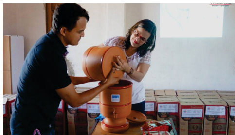
Mais de 300 filtros de água distribuídos através do Projeto Valente sem Sede.