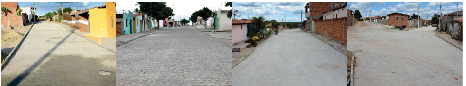
Pavimentação de mais de 67 ruas na sede e comunidades rurais, totalizando mais 65 mil m².