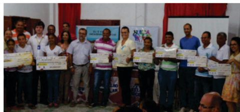
Destinação de R$ 70 mil em 2015 e R$ 90 mil em 2016 para Projetos Sociais do Fundo da Infância e Adolescência - FIA. Beneficiando crianças e adolescentes