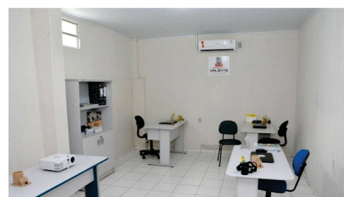
Espaço próprio e equipado para a diretoria da Agricultura Familiar.