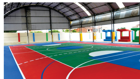
Cobertura e revitalização da quadra da Escola Cecília Meireles.