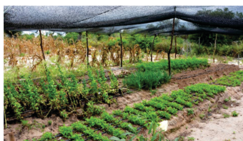
Mais de 100 famílias beneficiadas com hortas estruturadas e barreiros familiares.