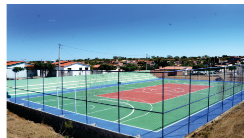
Construção de 03 Quadras Poliesportivas (Queimada do Curral e 02 na praça Nemésio Martins).