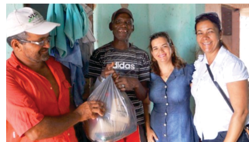
Mais de 10.100 cestas básicas distribuídas com recursos próprios.