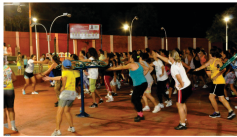
Implantação do Projeto Saúde na Praça com profissionais especializados em atividades físicas.