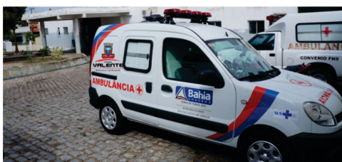
Aquisição de uma nova ambulância e uma kombi.