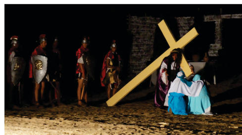
Apoio a todas edições da Paixão de Cristo.