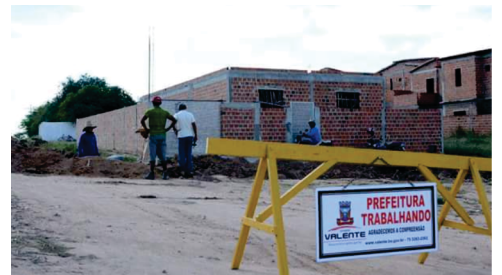
Construção de mais de 10 mil metros de rede de esgoto com recursos próprios.