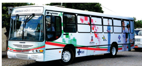
Recuperação do ônibus odontomédico com recursos próprios.