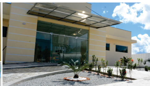
Construção e funcionamento da Unidade de Saúde da Família. Bairros Juazeiro e Petrolina.