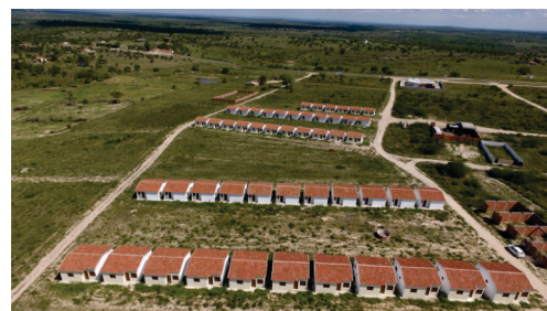
Construção de 50 Casas Populares Conjunto Maria Nunes da Silva.