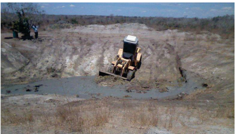
Limpeza de mais de 1.200 aguadas em todas as comunidades com recursos próprios.