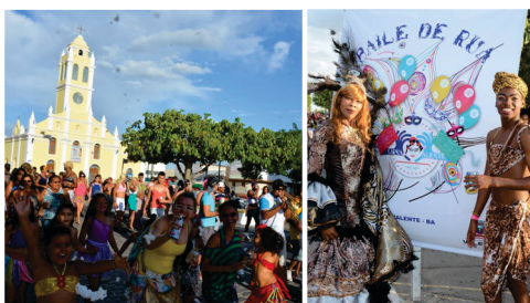
Revitalização do Carnaval Tradicional.