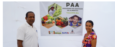
Programas de Aquisição de Alimentos do Governo Federal - PAA beneficiando mais de mil famílias carentes com produtos da agricultura familiar e R$ 203 mil de investimentos.