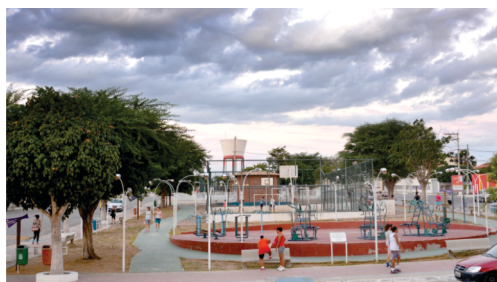
Construção da Praça Nemésio Martins.