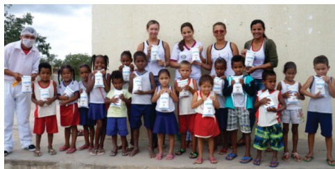
309 crianças contempladas semanalmente, com o Programa Leite Fome Zero, mais de 400 mil litros distribuídos por ano.