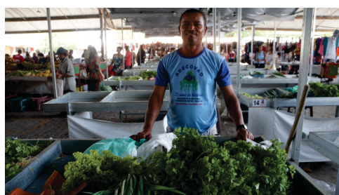
Doação de 60 barracas para agricultores familiares com espaço próprio na feira livre.