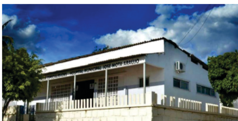
Criação do AME - Ambulatório Médico de Especialidades, com médicos especialistas atendendo gratuitamente a população.