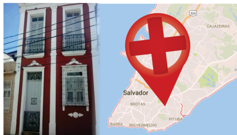
Reativação da Casa de Apoio em Salvador.