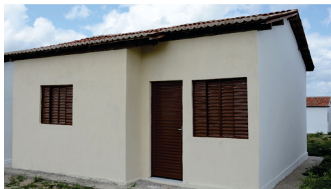
Construção e entrega de 50 Casas Populares no bairro Cidade Futuro.