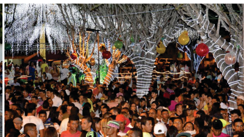
Realização das melhores festas de São João, Aniversário da Cidade e Revéillon.