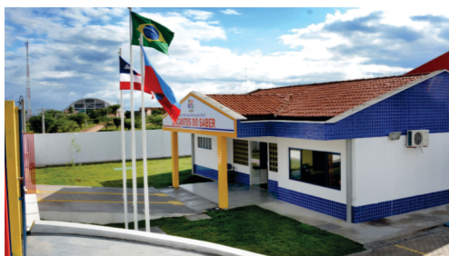
Construção da Creche Proinfância Encantos do Saber.