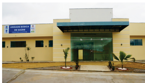
Construção e funcionamento da Unidade de Saúde da Família. Bairros Cidade Nova e Liberdade.