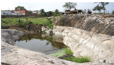
Revitalização do Caldeirão do Boi Valente.