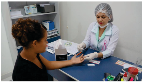
Funcionamento do PSF das Casas Populares com enfermeira, médico e dentista.