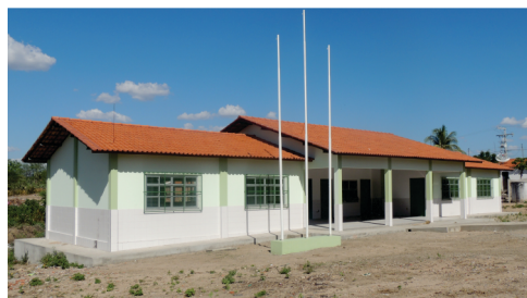
Construção de uma Escola Estadual Rural de Ensino Médio na Comunidade de Tanquinho.