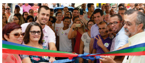
Projeto Valente contra a Seca junto a União Europeia com investimentos em assistência técnica, construção de cisternas e kits de produção.