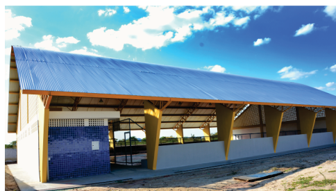
Construção do Ginásio de Esportes do Junco.