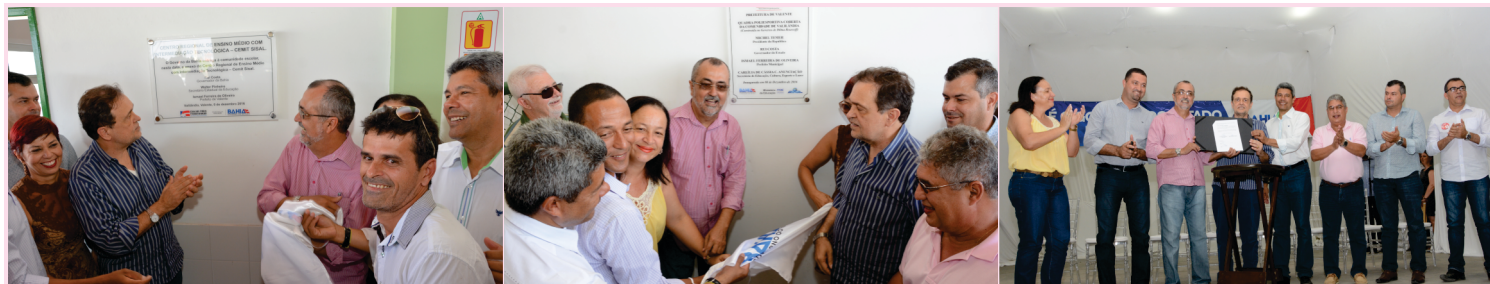
Inauguração das Escolas Estaduais de Tanquinho e Valilândia, Ginásio de Esportes de Valilândia e assinatura de convênios com as presenças do Dep. Estadual Rosenberg Pinto e dos Secretários Estaduais Walter Pinheiro (Educação) e Jerônimo Rodrigues (Desenvolvimento Rural)