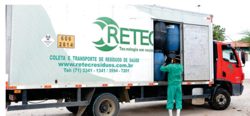
Durante os 04 anos o lixo hospitalar foi recolhida por empresa ambiental especializada.