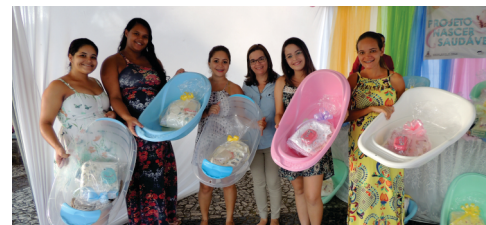
Mais de 300 kits para recém nascidos distribuídos para gestantes, através do Projeto Nascer Saudável, para recém-nascidos.