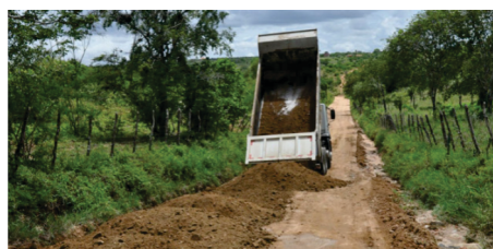
Encascalhamento das estradas de Valilândia, Santa Rita e Itareru de Cássia junto ao Governo do Estado e recursos próprios.