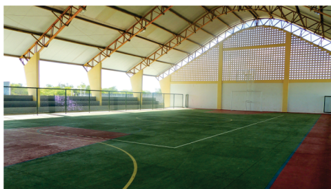
Construção do Ginásio de Esportes de Valilândia.