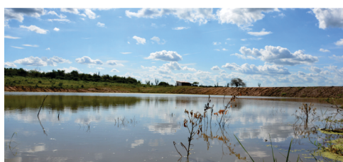
Construção de 06 aguadas de grande porte. (Peixe, Itarerú, Vargem Grande, Queimada do Curral, Papagaio e Alagadiço Grande).