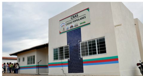
Conclusão e funcionamento do Centro de Referência de Assistência Social - CRAS das Casas Populares.