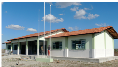
Construção de uma Escola Estadual Rural de Ensino Médio na Comunidade de Valilândia.