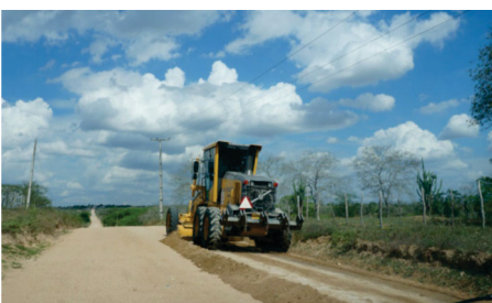
Todas as estradas patroladas e conservadas com constante manutenção.