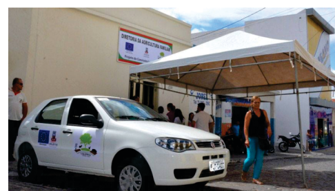
01 Carro 0km e 01 moto 0km adquiridos para a diretoria da agricultura familiar.