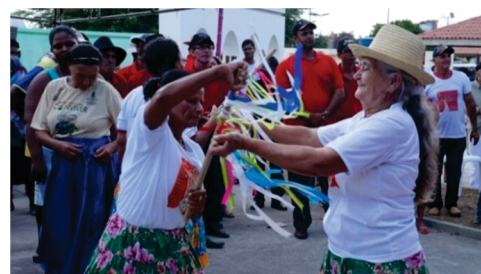
Apoio aos grupos de roda, reisado e outros.