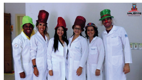
Implantação do NASF (Núcleo de Saúde da Família).