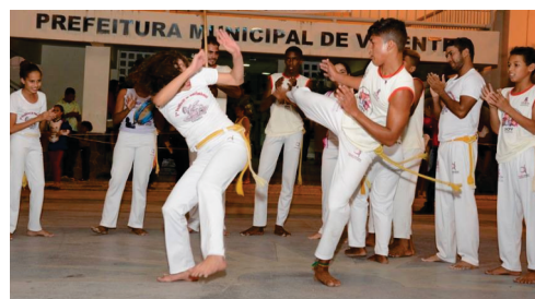
Realização de 04 Semanas da Cultura.